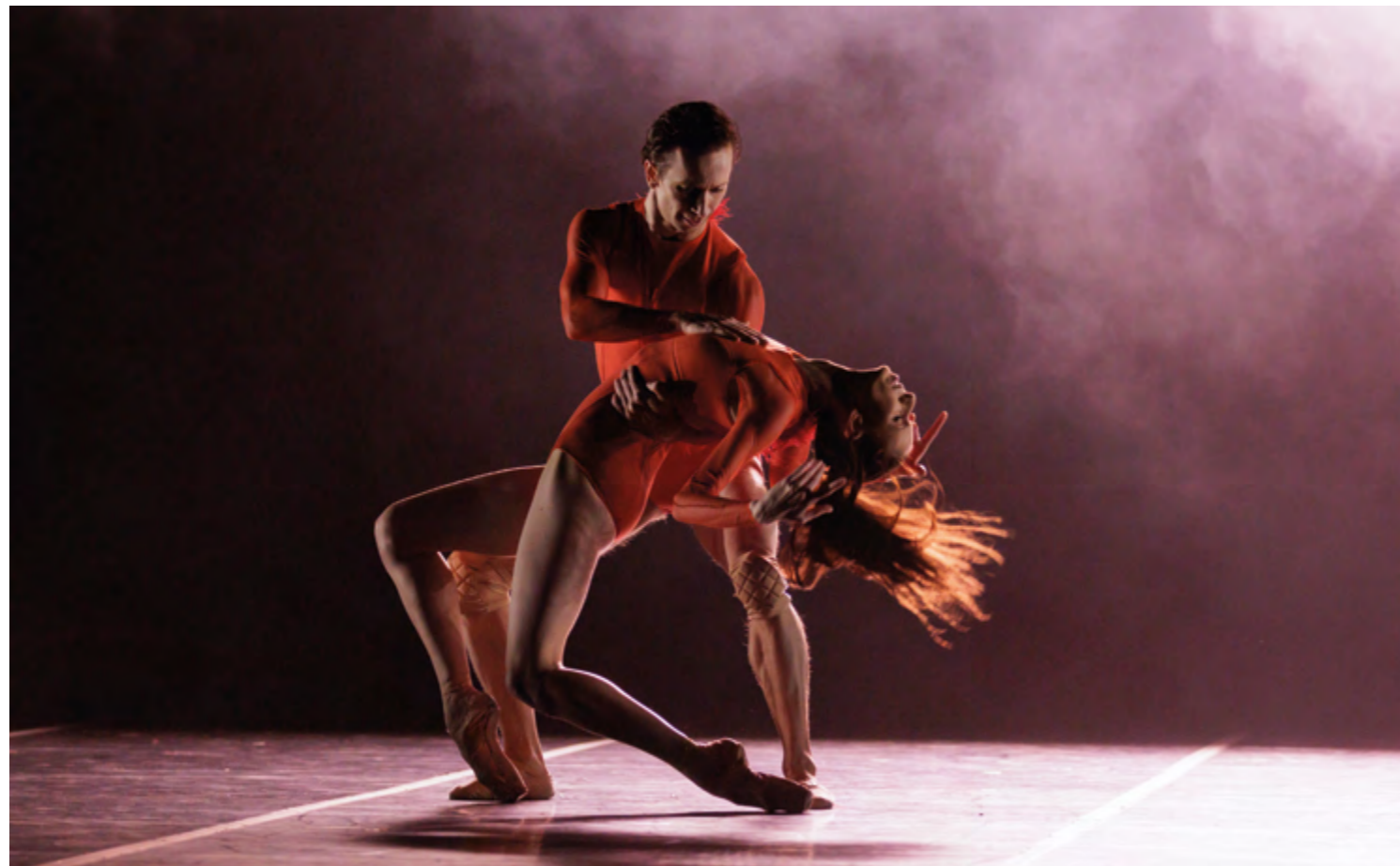
Real Love